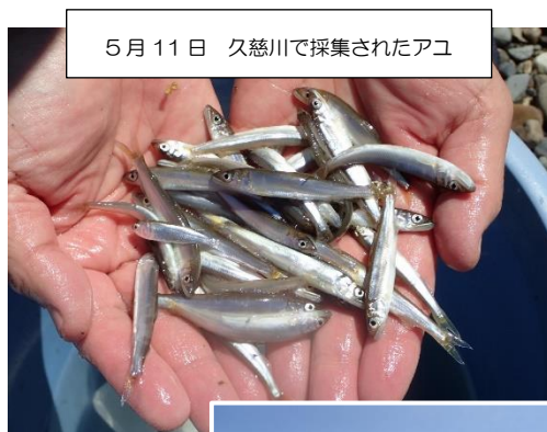
5月11日 久慈川で採集されたアユ