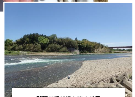
那珂川千代橋上流の様子

連絡先 茨城県水産試験場内水面支場 内水面資源部：0299-55-0324（代）