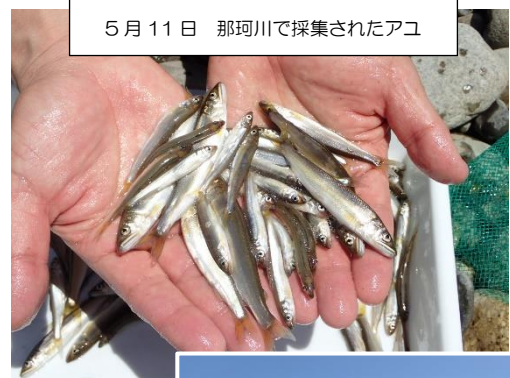
5月11日 那珂川で採集されたアユ