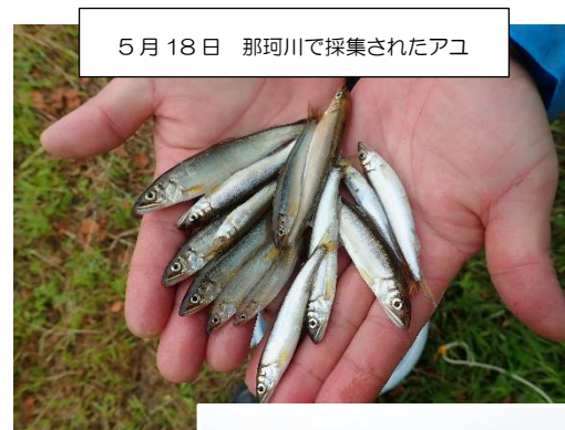
5月18日 那珂川で採集されたアユ