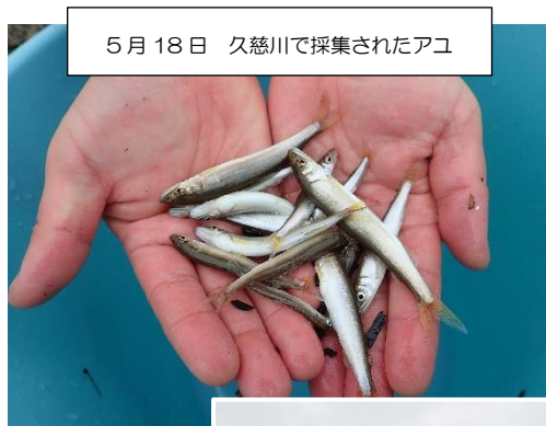
5月18日 久慈川で採集されたアユ