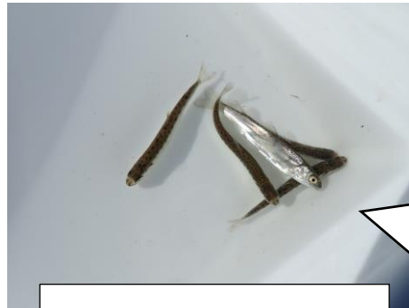
2月28日 那珂川で採集されたサケ

那珂川ではアユ遡上は確認されませんでした。サケの稚魚が採集されました。 (1尾/10投網) ※確認後、再放流