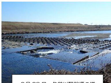
2月28日 久慈川堅磐堰の様子

那珂川ではアユ遡上は確認されませんでした。サケの稚魚が採集されました。 (1尾/10投網) ※確認後、再放流