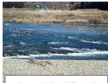
2月28日 那珂川千代橋上流の様子

連絡先 茨城県水産試験場内水面支場 内水面資源部：0299-55-0324（代）