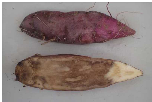
なり首側からの塊根腐敗