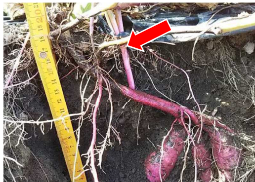
黒変が茎基部からなり蔓へ