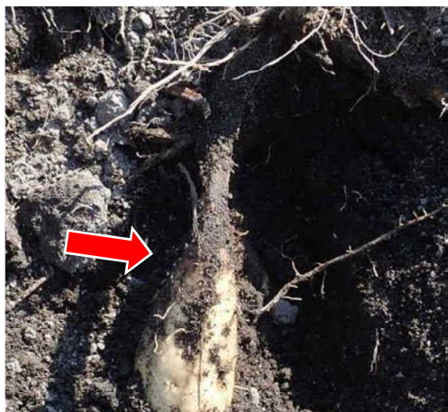
黒変がなり蔓から塊根へ到達