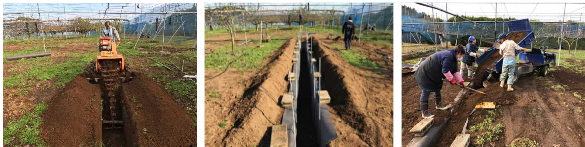
図1 側部根域制限処理及び土壌処理の方法

※根域制限深さ 50 cm区は、トレンチャーを用いて幅 50 cm、深さ 50 cmの溝を掘った(左)。根域制限深さ 100cm 区は、油圧ショベルを用いて幅約 70cm、深さ 100cmの溝を掘った。掘った溝の両側に遮根シートを設置して、側部の根域を制限し、周囲から隔離した(中央)。無処理区は、トレンチャーを用いて幅 50 cm、深さ 30cmの溝を掘り、定植の際に埋め戻した。客土区はナシの栽培歴がない土壌を埋め戻した(右)。高温水処理区は、溝に掘り上げた土を埋め戻した後、高温水点滴処理(点滴チューブから滴下する温度は 60°Cに設定)を直線状に行った。また、仕立て方は一文字仕立て、1試験区あたり7本の「幸水」を栽植した。