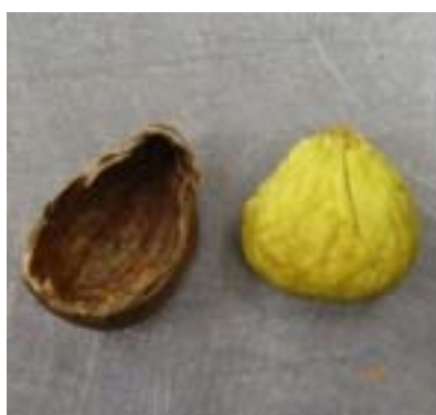
図2. 電子レンジで剥皮した「ぼろたん」

注) 鬼皮にナイフ等で果肉まで達する程度の傷を数本付けた後、電子レンジ(700W)で2分間加熱