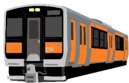
Orange Persimmon Train