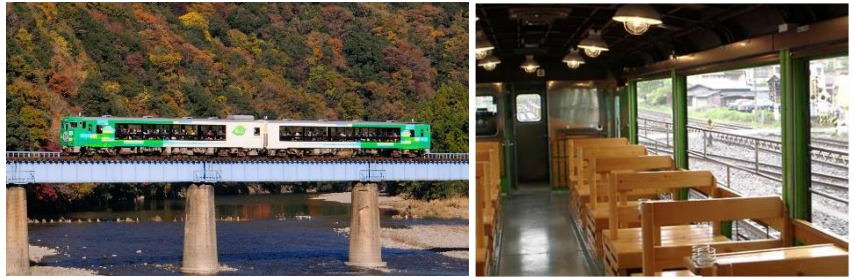
※写真はイメージです。秋の「風っこ」については窓を付けて運転します。

水郡線の豊かな自然のなかを「びゅうコースター風っこ」が走ります。開放感あふれる車両から、車窓一杯に広がる久慈川の溪流と山々の紅葉をお楽しみいただけます。