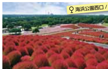
♀ 海浜公園西口 / 南口