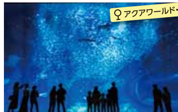
♀ アクアワールド・大洗

7つのエリアのある、開園面積約215haの広大な公園。秋の風物詩は真っ赤なコキアと多彩なコスモス。大観覧車などアトラクションも豊富で、子どもから大人まで楽しめるスポットです。