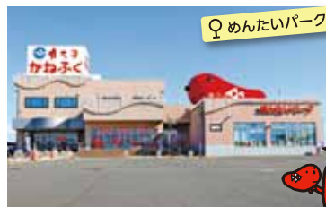
♀ めんたいパーク大洗

創建は856年。太平洋に面した立地で、境内から海を一望できます。御祭神が降臨されたといわれている岩礁に建つ「神磯の鳥居」は、絶景名所として知られる見どころのひとつです。