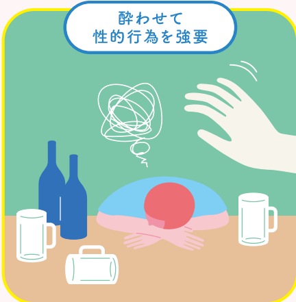
酔わせて 性的行為を強要