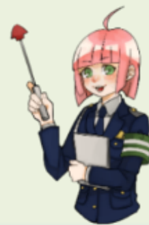
市町村別認知件数(令和5年中)