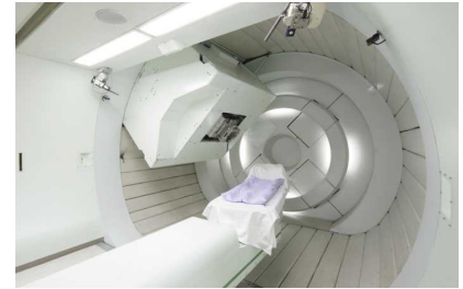
※陽子線治療装置(筑波大学附属病院)

※先進医療の詳細については、厚生労働省のホームページをご覧ください。「厚生労働省 先進医療」で検索 ※先進医療のうち、がんの治療を目的に行われるものが、利子補給の対象となります。