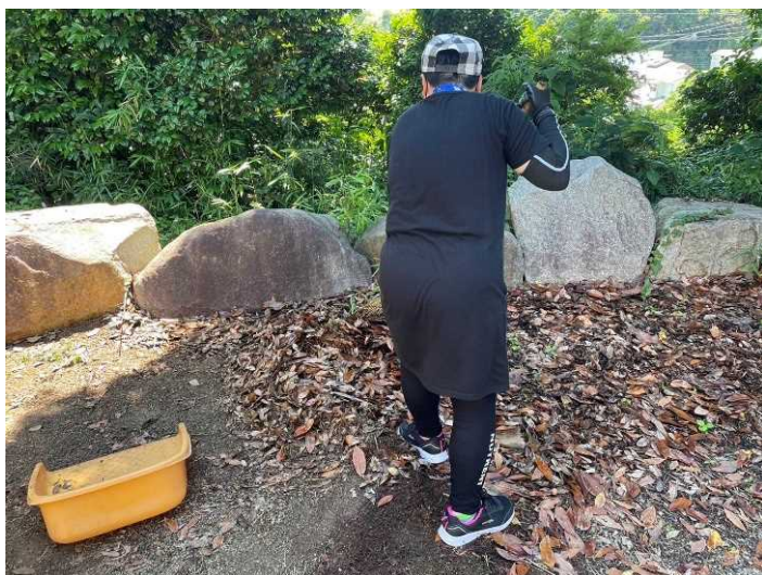
作業の様子（清掃作業）