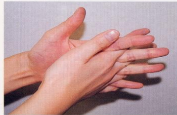
4. 指の間を十分に洗う