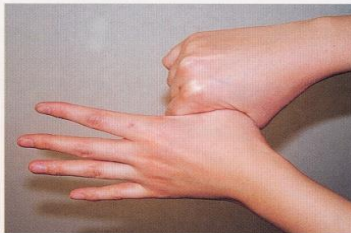
5. 親指と手掌をねじり洗いする