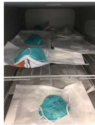
図 2：ロード用の N95 マスクの包装と棚への積載例