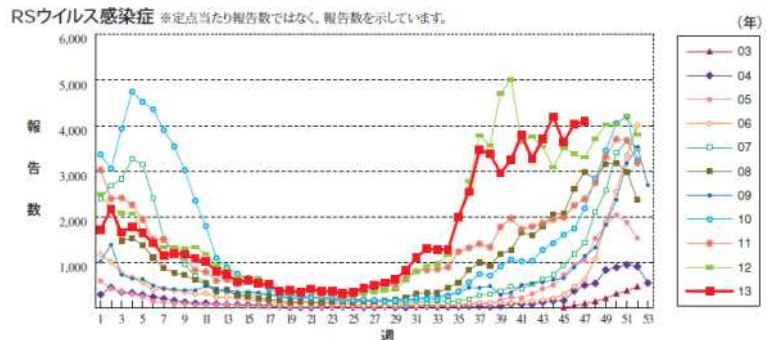
図1. RSウイルス感染症の年別・週別発生状況（国立感染症研究所）

RSウイルス感染症は、例年冬期にピークが見られていましたが、2011年以降は7月頃から患者報告数の増加傾向がみられるようになりました。2013年は6月下旬（第25週）から徐々に増加傾向がみられ、特に8月下旬から9月上旬（第34週から第35週）にかけて急激な増加がみられています。