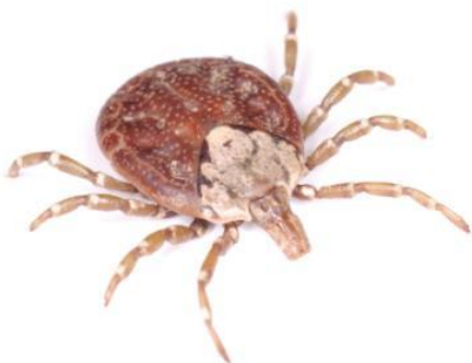
タカサゴキララマダニ（吸血前：約7mm）

マダニに咬まれていることに気が付いた場合、無理に引き抜こうとするとマダニの一部が皮膚内に残って化膿したり、マダニの体液を逆流させてしまったりするおそれがあるので、医療機関（皮膚科など）で処置（マダニの除去、洗浄など）をしてもらってください。また、マダニに咬まれた後、数週間程度は体調の変化に注意をし、発熱等の症状が認められた場合は医療機関で診察を受けてください。