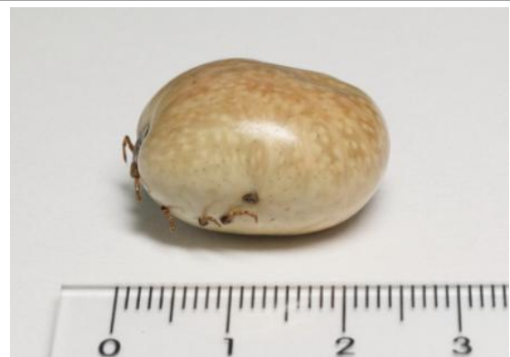
タカサゴキララマダニ（吸血後：20mm以上）