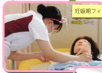
妊娠期フィジカルイグザミネーション