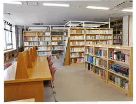
図書室：約 20000 冊