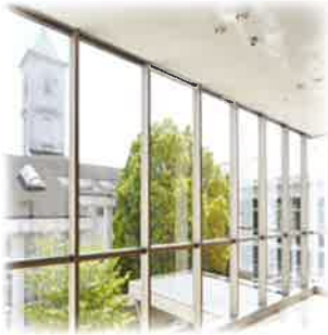
学校のシンボル時計台