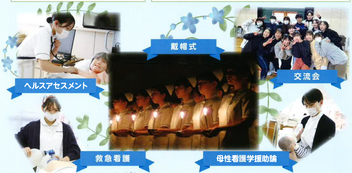
ヘルスアセスメント