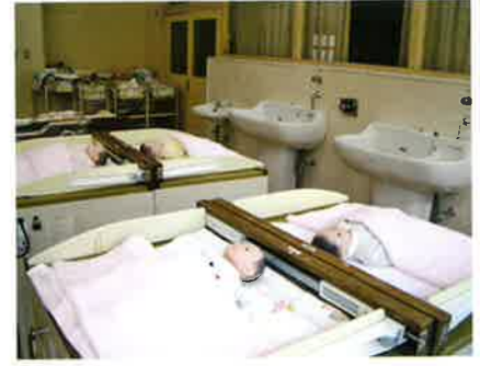
沐 浴 室