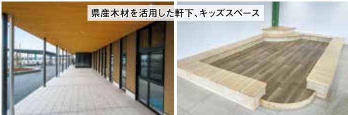
県産木材を活用した軒下、キッズスペース