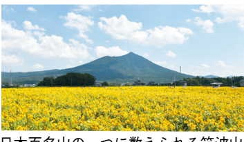
日本百名山の一つに数えられる筑波山

議員 障害者が地域の一員として共に生活できる「共生社会」実現のため、障害者雇用に積極的な企業に認証マークを交付する制度の導入を望む。また、支援機関との連携強化や就労支援を担う人材育成を図るべきと考えるが、所見は、産業戦略部長 障害者雇用に積極的な企業に認証マークを交付する「障害者雇用優良企業認証制度」を今年度創設する。また、人材育成や支援機関との連携強化を図る。