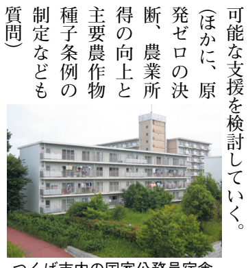
つくば市内の国家公務員宿舎