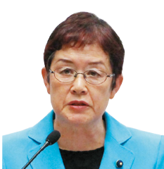
山中 たい子 議員 国民共産党 本共市選出 一括方式