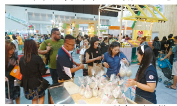
タイ食品見本市でのメロン試食販売の様子

(ほかに、働く世代のがん対策、茨城国体・全国障害者スポーツ大会の機運醸成なども質問)