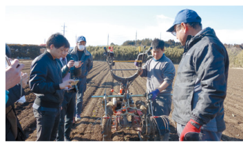
作業軽減のためのロボット開発の様子

議員 虐待の見逃しや深刻化を防ぐため、関係機関との連携強化や児童相談所の体制強化が重要だと考えるが、今後の取り組みは、保健福祉部福祉担当部長 一月から、全ての児童虐待事例を県警察本部へ情報提供し、連携を深めている。また、児童相談所の体制強化のため、児童福祉司などの必要な人員を計画的に確保していく。