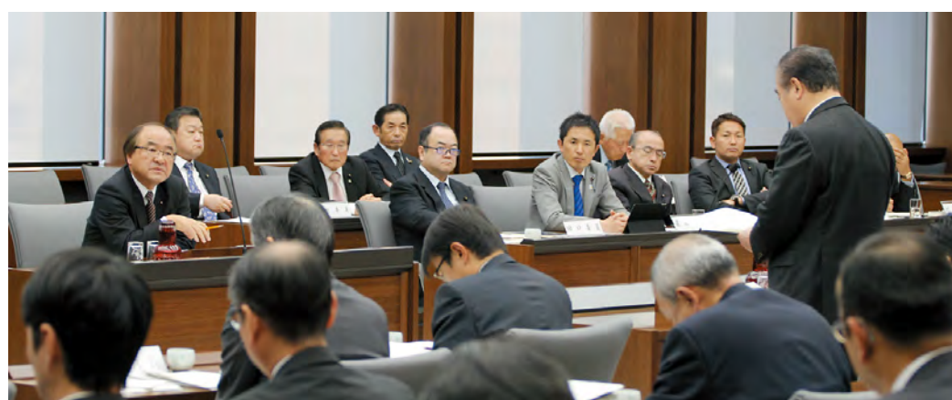
12月20日に行われた予算特別委員会の様子

知事 答申に茨城県に関する記述が初めて盛り込まれ、大変喜んでいる。今後、県内延伸に向け、定住人口や交流人口の拡大に取り組み、鉄道整備が必要とされる状況をつくっていく。この地域の担う首都圏の防災機能のあり方や野田市までの延伸の動きを踏まえ、五年ごとの県総合計画改定の際には、本県の将来像などにも適切に反映させながら取り組んでいきたい。(ほかに、茨城の将来像と県西地域の振興策、本県の魅力向上なども質問)