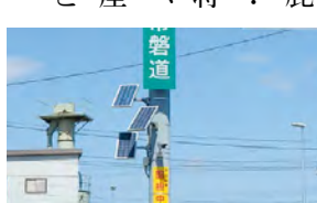
県境に設置されている不法投棄監視カメラ

(ほかに、鹿島港の整備・利用促進と将来ビジョン、稼げる観光産業の振興なども質問)