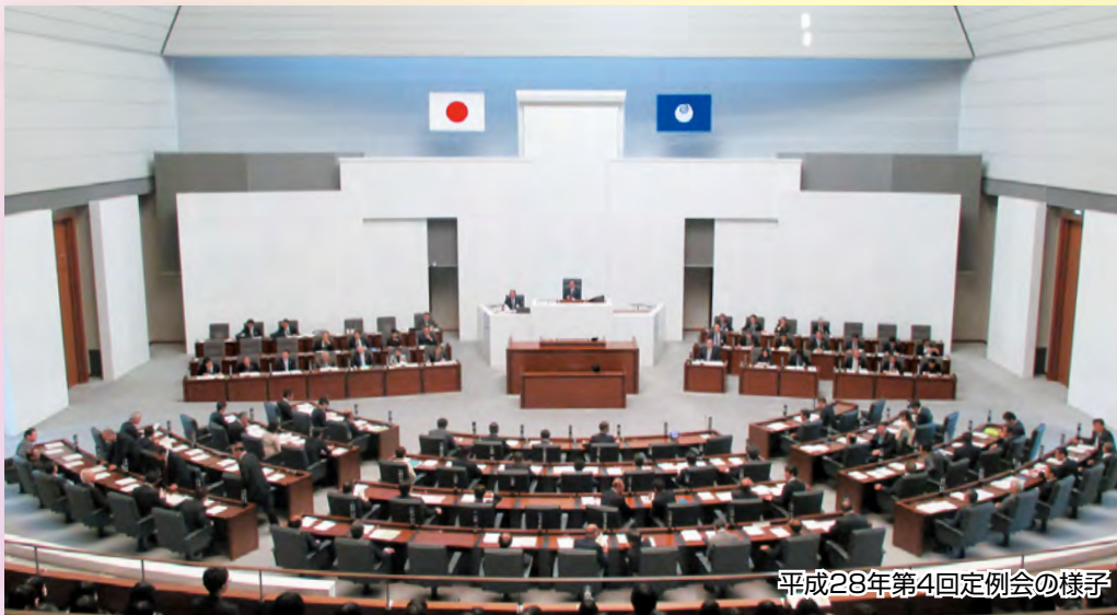
平成28年第4回定例会の様子