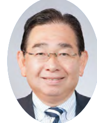
議会 代表 茨城県 公明党 議員