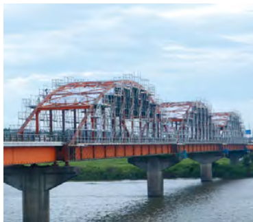
橋りょう(長豊橋)の修繕工事の状況

問 橋りょうの維持管理にかかる予防的な修繕について、どのような効果があると考えているか。 答 平成二十一年度に策定した橋りょう長寿命化修繕計画の見直しを昨年度実施した。この計画に基づいて予防的な修繕を行うことで、ライフサイクルコストの縮減や将来の老朽化による架け替えの抑制などの効果が期待される。 問 県南県西地域では、企業立地が増加しているが、当該地域の工業団地に対する工業用水の供給体制は。 答 水海道浄水場の供給エリアでは供給が逼迫している