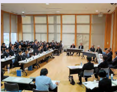
文教警察委員会の様子

・就学前教育の充実 ・家庭・地域の教育力の向上 ・豊かな心と健やかな体を育む教育の充実