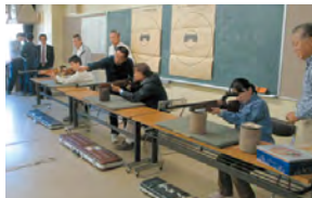
銃猟免許研修会の様子

(ほかに、筑波山へのアクセシビリティ向上対策、Wi-Fi環境の整備推進、高齢者就労対策なども質問)