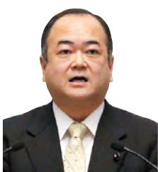
田口 伸一 議員 いばらき自民党 鹿嶋市選出 一括方式