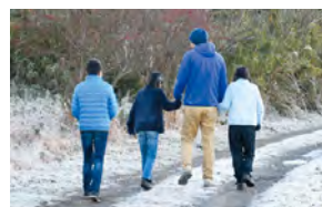
親子の語りから始まる家庭教育

議員 各家庭が家庭教育に対する責任を自覚し、社会全体がその自主性を尊重しつつ一体となった支援が必要である。家庭教育の充実を図る上での全県的な取り組みは、 教育長 家庭教育支援条例制定の動向や就学前教育・家庭教育の基本的方向となる推進ビジョンの策定を踏まえ、全ての家庭に届く家庭教育支援を目指し取り組んでいく。各種団体や企業などの連携を強化し、社会全体で家庭教育支援の充実に取り組んでいく。