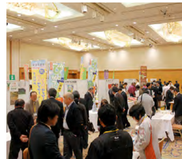
「春のフードビジネスフェアいばらき2016」での商談会の様子

問 本県の豊富な農林水産物を活用して、地域特産品やお土産商品の開発などを行う、農商工連携への取り組みは。 答 関係者が地域資源を生かした商品開発を進めるに当たっては、県や国の支援制度をPRするとともに、商談会や展示交流会の開催、地域人材育成マーケティング塾の実施など、さまざまな取り組みを通じて支援していく。 問 災害廃棄物の処理に当たっては、効率良く作業を進めるためにも、しっかりとした分別が重要であると考えるが。 答 分別の徹底により、処理に要する費用や時間を抑えら