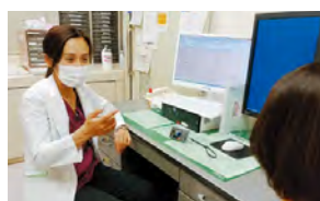
活躍する女性医師