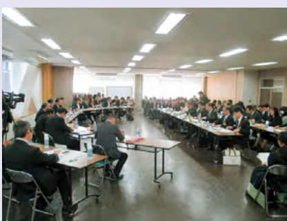
保健福祉委員会の様子

・結婚・妊娠・出産・子育ての切れ目のない支援 ・援護を必要とする子ども達への支援 ・高齢者の活躍促進