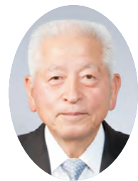
自民党 議長 いばらき 議員会長