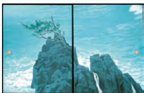
「唐招提寺御影堂障壁画 濤声」(部分) 昭和50年 唐招提寺蔵

知事 現在、同計画に基づき、教育、就労、生活および経済的支援の四つを柱に、総合的に取り組んでいる。今後も、全庁を挙げて、これらの取り組みを着実に実施するとともに、生活困窮者などからのニーズの把握に努め、子どもの貧困対策を積極的に推進する。