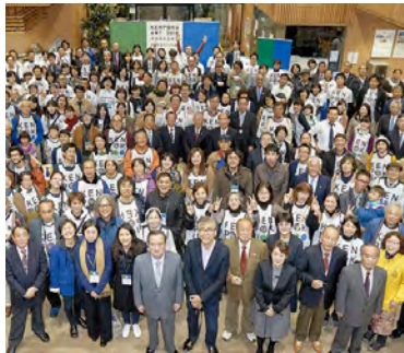
県北芸術祭の閉会式の様子

問 茨城県北芸術祭の経済波及効果の分析は、どのようにいつ頃までに行うのか。 答 民間に委託し、来場者アンケートなどを基に属性の分析や消費額の推計を行っており、定性的な評価も含め、一月中を目途に経済波及効果の分析を進めていきたい。実行委員会内で議論しながら、最終的に芸術祭全体の報告書として作成していく。 問 二月十六日から四日間、取手競輪場で初めてG1レースが行われる。今後もグランプリを視野に誘致に力を入れて欲しいが、どうか。 答 これまでも誘致活動をし