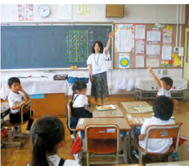
小規模学校の授業風景

問 小中学校は地域の中心であり、小規模でも頑張っている学校が存続できるような支援を考えるべきであるが県の取り組みは。 答 国でも学校の適正配置の考え方を見直しており、県としても地域や子供の教育環境などを踏まえ、小規模校の存続に取り組む市町村に対し、取り組み事例を提供するなどにより支援していく。 問 高齢運転者による事故が多発しているが、その対策の一つである運転免許自主返納推進への取り組みは。 答 自主返納しやすいよう運転免許センター日曜窓口での