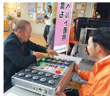
高齢者への交通安全啓発活動の様子

問 運転免許更新時に七十五歳以上の方には認知機能検査を実施しているが、高齢者の運転事故防止の観点から、県はどのような対策を行うのか。 答 認知症疾患医療センターの医師などを対象とした研修を行っているが、今後は道路交差法の改正に伴い専門医による診断の必要が増加することから、医師や県警と連携して体制を整備していく。 問 少子化対策には、小児医療の充実も重要だと考えるが、今後どう進めていくのか。 答 県立こども病院では、昨年十一月から水戸市の休日夜間緊急診療所への医師派遣を