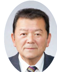
自民県政 クラブ代表