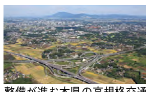
整備が進む本県の高規格交通インフラ(つくばJCT)