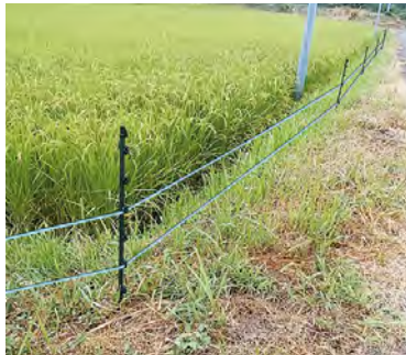
水田に設置された電気柵

問 イノシシ被害は県内全域に拡大しており、耕作自体を断念するなど被害金額には表れない二次的被害もあるが、今後の対策は。 答 これまで国の交付金を活用して、電気柵の設置などを支援してきたが、イノシシによる農作物被害対策を求めめる声が高まっていると認識しており、県独自の抜本的な対策がとれるよう検討していく。 問 常総IC周辺で計画している生産・加工・流通・販売が一体となったアグリサイエンスバレーの整備に向けた農林水産省との調整状況は。 答 十二月中にほぼ終了する