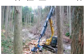
路網を利用した森林整備の状況(常陸太田市)

議員 国では、畜産クラスター事業*に多くの予算を措置しており、本県でも積極的に活用すべきである。本事業を活用して今後どのように畜産振興を図っていくのか。