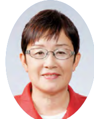
党会 議長 日本共産 茨城県 議員団