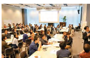
若手医師の研修風景

(ほかに、「泳げる霞ヶ浦」を目指した取り組み、学校におけるLGBT※への対応なども質問)