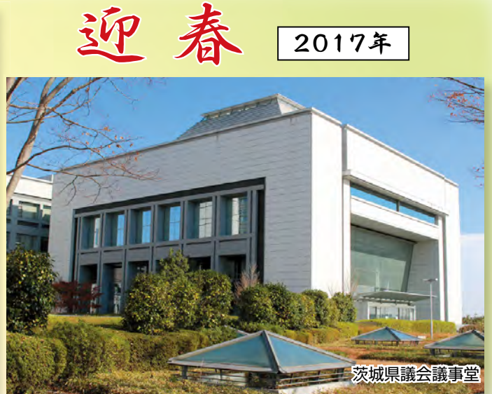
茨城県議会議事堂