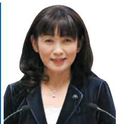
安藤 真理子 議員 いばらき自民党 土浦市選出 一括方式