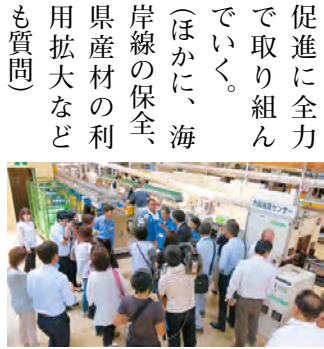
海外バイヤーによる産地視察の様子

議員 TPPの大筋合意を契機として、県や市町村が産業振興のためにジェット口茨城と連携を深めることは、課題の一つである。ジェット口茨城を活用して、今後どのように輸出を促進していくのか。 商工労働部長 今後はジェット口茨城において、市町村ごとにジェット口活用セミナーを開催する予定である。県においても、市町村などと一層連携を強化し、本県の輸出促進に全力で取り組んでいく。