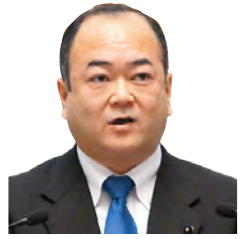
田口 伸一 議員 いばらき自民党 鹿嶋市選出 一括方式