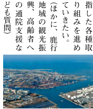
整備が進む鹿島港

議員 今年度中の「いばらき水素戦略」の策定に向け、どのような視点で進めていくのか、また、水素社会の実現に向けてどのような取り組みを進めていくのか。 企画部長 戦略は、水素の利活用促進、研究開発の促進および新たなビジネスの創造支援、県民理解の促進などを視点に策定を進め、戦略に基づき、水素ステーションの整備検討など、水素先進県を目指す。指した各種取り組みを進めていきたい。