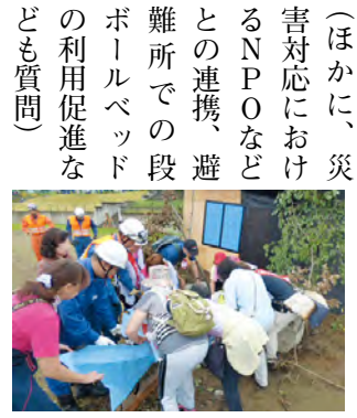
総合防災訓練の様子

議員 今回の水害で、常総市の新八間堀川にある樋管※の管理者が不明確で川の水位が逆流し、市街地が浸水した。こうした河川工作物の適正な管理にどう取り組むのか。 土木部長 今回問題の樋管は、常総市と協議し、市が管理を行う方向で手続きを進めている。他の県管理河川の樋管も実態調査を行い、管理者の特定や操作体制の整備など適正な管理を図っていく。