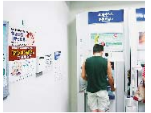
オレオレ詐欺の注意を呼びかけるポスター