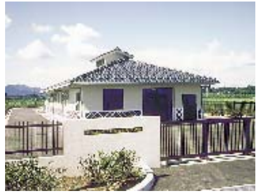
生活を向上させる農業集落排水事業(汚水処理施設)