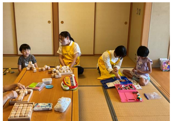
令和5年の休日議会における託児の様子