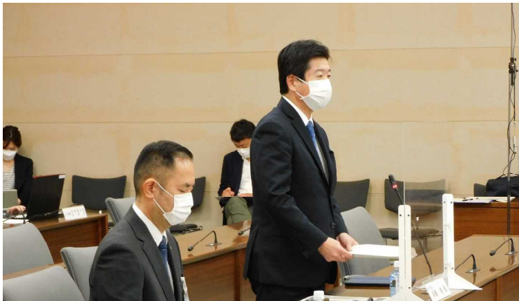
高橋水戸市長 関係者意見聴取