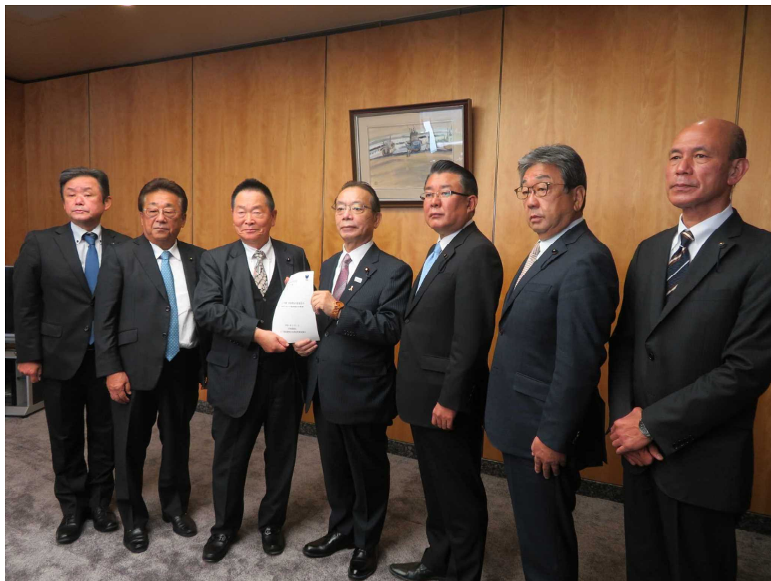
谷 公一 国家公安委員会委員長への要請活動