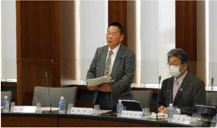
海野会長 協議会開会のあいさつ