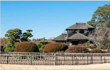
借楽園「好文亭」での茶会