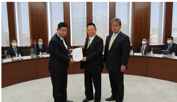
海野会長（中央）と 中村副会長（右側）から 執行部へ提言書の手交