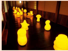
「道」を照らす「水府提灯」