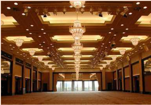
水戸プラザホテル