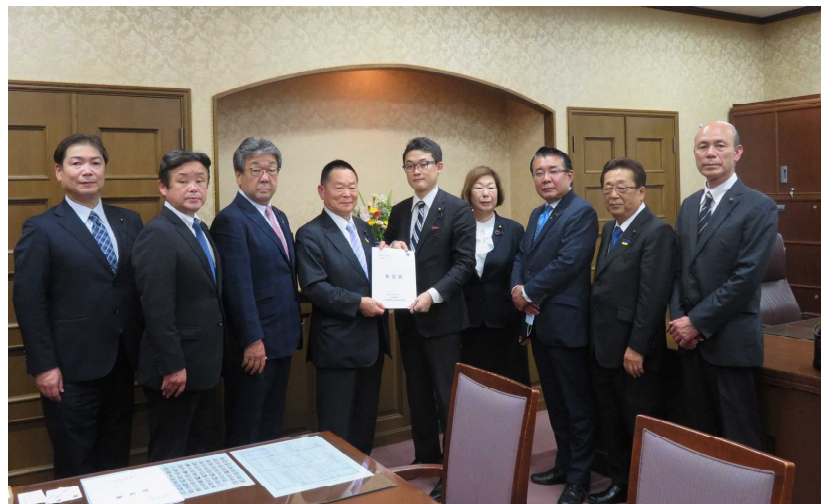
藤原 崇 財務大臣政務官への要望活動