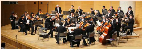
水戸芸術館・水戸室内管弦楽団コンサート