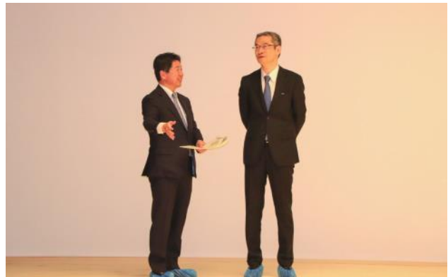
水戸市民会館中ホールでの視察