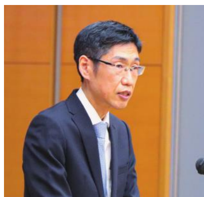
山田警察庁長官官房審議官（国際担当）