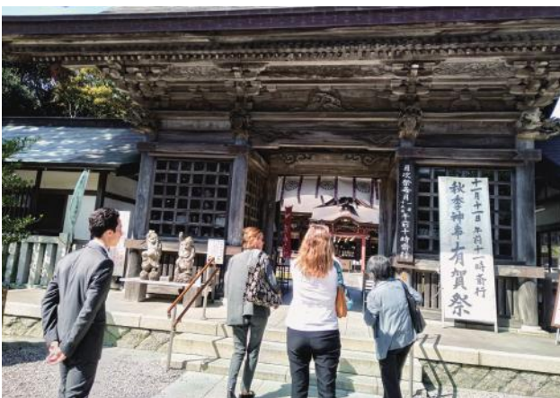
大使館関係者向け県内ツアー（大洗磯前神社）