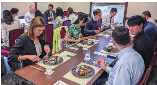
レストランイジマでの昼食会