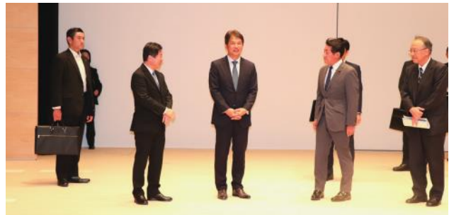
水戸市民会館中ホールでの視察