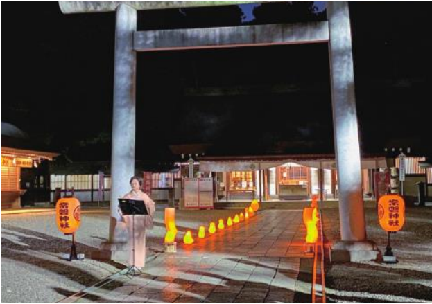
常磐神社での篠笛演奏、ライトアップ