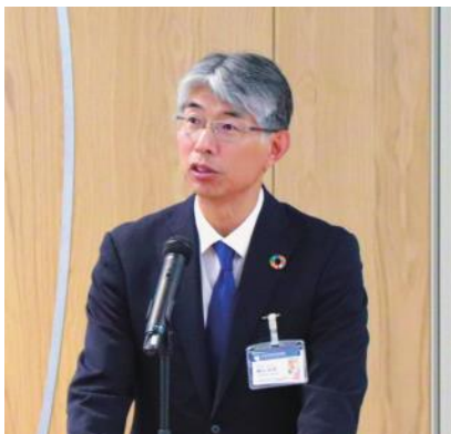
協議会副会長の横山副知事