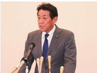
松村国家公安委員会委員長会見