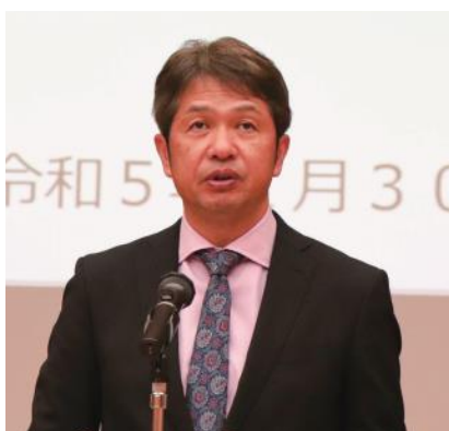
協議会会長の大井川知事