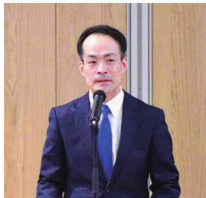
秋本警察庁長官官房参事官（国際担当）