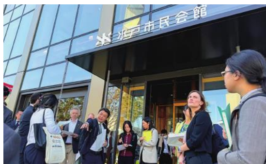
水戸市民会館の視察

参 加 者：イタリア・カナダ・フランス・米国・英国・ドイツ大使館職員、EU代表部職員、INTERPOL職員 計18名