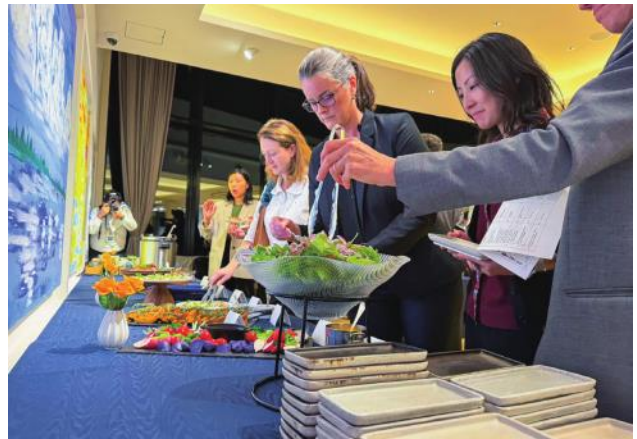
ときわ邸M-GARDENでの夕食会