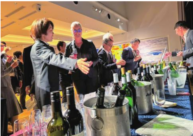
茨城県産のワインや地ビールの試飲会