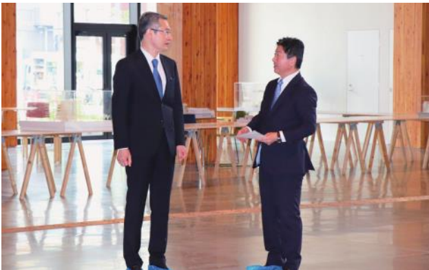
水戸市民会館やぐら広場の視察