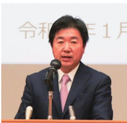
協議会副会長の高橋市長