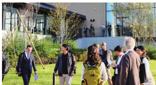
The 迎賓館 偕楽園 別邸視察