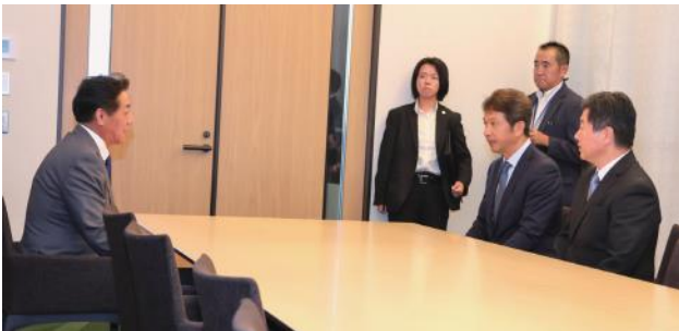
水戸市民会館特別会議室での面会