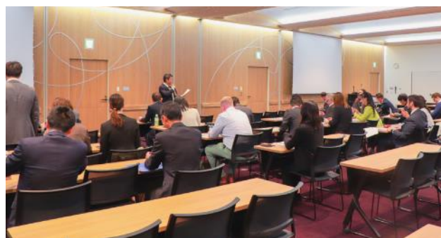
水戸市民会館大会議室の視察