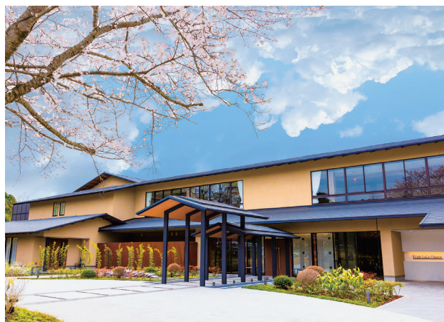
⑤The 迎賓館 偕楽園 別邸（ワーキングディナー）