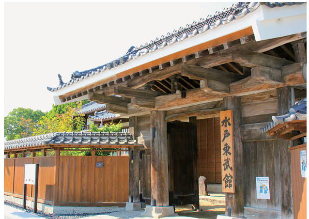
④水戸東武館（エクスカーション（文化プログラム））