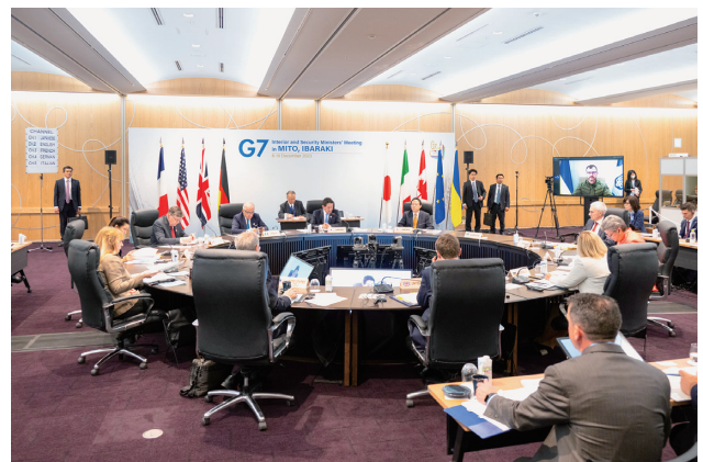
水戸市民会館 大会議室