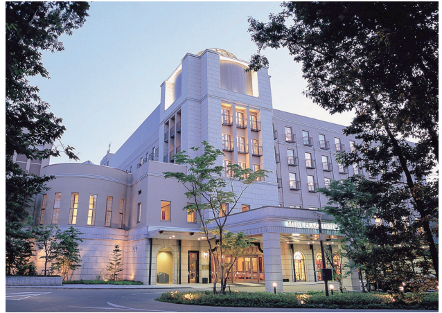
②水戸プラザホテル（歓迎レセプション、各国・機関代表団宿泊）