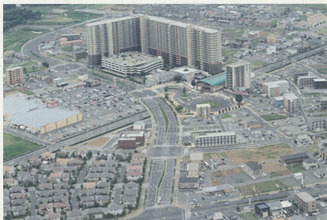
▲ 市街化が進むみらい平駅周辺