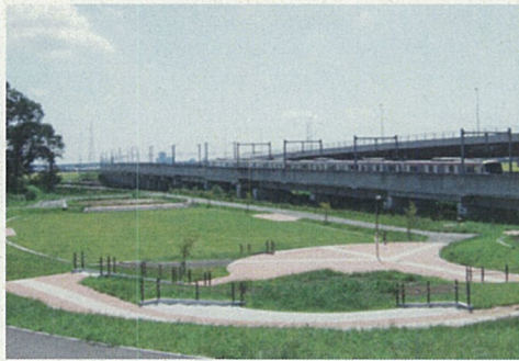
みらい平さくら公園