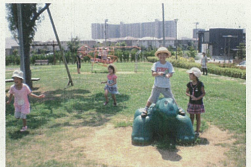
きょうりゅう公園