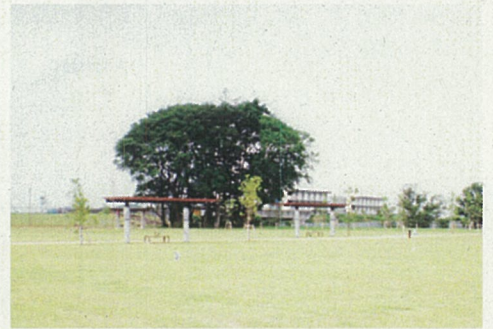
みらい平どんぐり公園