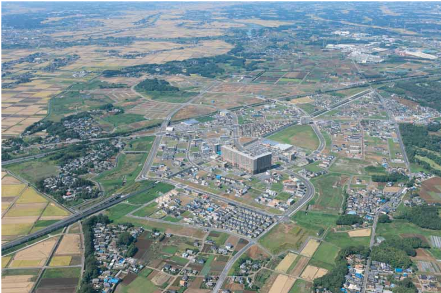
●●● 上空からみた みらい平地区の様子 ●●● (平成21年9月撮影)