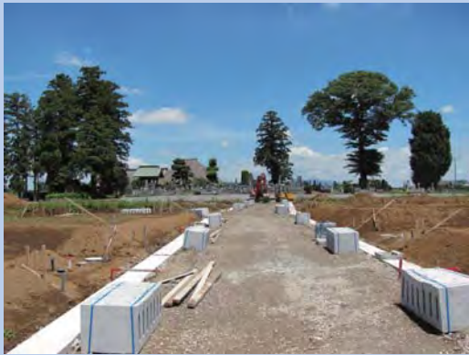
①区画道路工事の様子

平成26年度は、造成工事や道路工事等を予定しております。 工事箇所周辺の皆様にはご迷惑をおかけしますが、ご協力をよろしくお願いいたします。 なお、工事予定箇所は、今後変更になることがございますので、あらかじめご了承下さい。