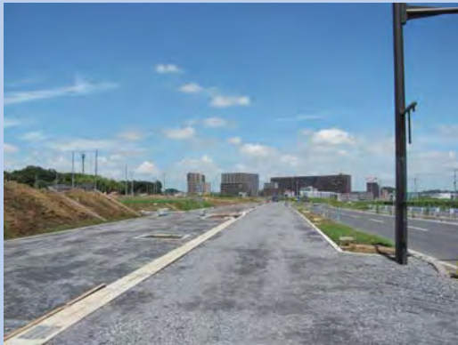
②新都市中央通り線の歩道工事の様子