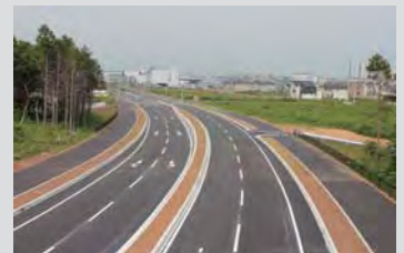
葛城地区から面野井酒丸線までの区間

新都市中央通り線は、つくば市中心部を起点に、つくばエクスプレス沿線の各開発地区を結び、常磐自動車道谷田部IC付近に至る計画延長13.6kmの幹線道路で、新たなまちづくりの促進、さらには県南地域の連携強化に資する重要な路線です。これまでに、約10.8km区間が供用されており、平成25年7月22日に葛城地区から面野井酒丸線までの260m区間が開通しました。現在、つくば市内の面野井酒丸線から県道土浦坂東線バイパスまでの0.8km区間の整備が進められています。