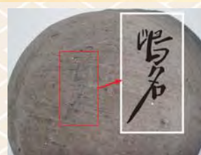
出土した「嶋名」と書かれた奈良時代の土器

現在の島名・福田坪地区内には「島名熊の山遺跡」と「島名本田遺跡」があり、住宅跡などから古墳時代から平安時代の遺跡だと考えられています。また、島名熊の山遺跡では島名の地名が奈良時代にすでに存在していたことを示す「嶋名」の文字が書かれた土器が出土されています。