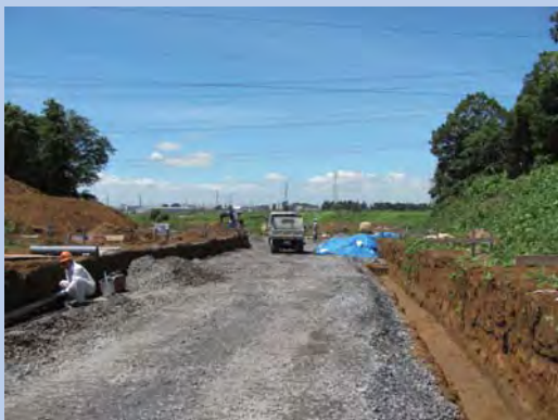
③谷田部萱丸線の道路工事の様子