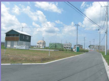
写真⑥ 昨年度末に使用収益が開始された紫峰ヶ丘1丁目エリア周辺には、続々と建築が進んでいます。