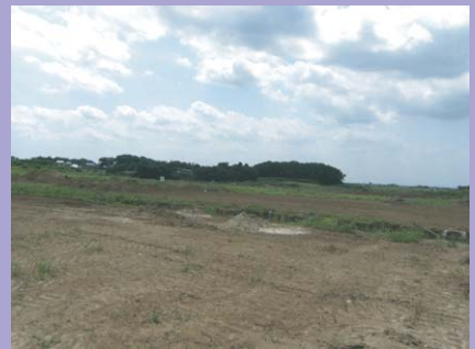
写真④ 富士見ヶ丘2丁目周辺(第3期エリア)の現場状況です。今年度宅地造成工事を行います。