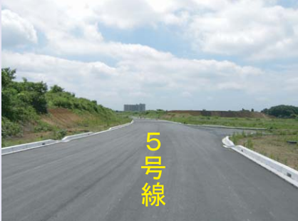
写真① 今年度電線共同溝工事を予定している5号線の状況です。

今年度は、5号線・6号線の「電線地中化工事」及び2期エリアの「区画道路舗装工事」、3期エリアの「宅地造成工事」等を予定しております。