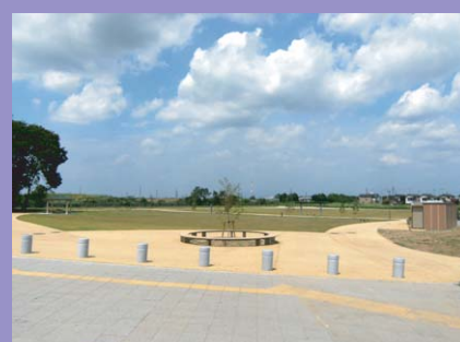
写真⑤ 紫峰ヶ丘4丁目に計画している近隣公園の完成が間近になりました。