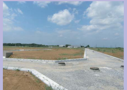
写真③ 紫峰ヶ丘3丁目周辺(第2期エリア)の現場状況です。今年末に舗装工事予定です。