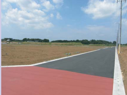
写真② 富士見ヶ丘1丁目周辺(第2期エリア)の舗装工事が最近完了しました。