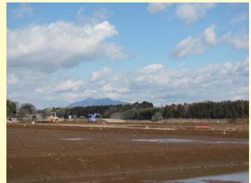
④島名上河原崎線北側の宅地整形工事の様子