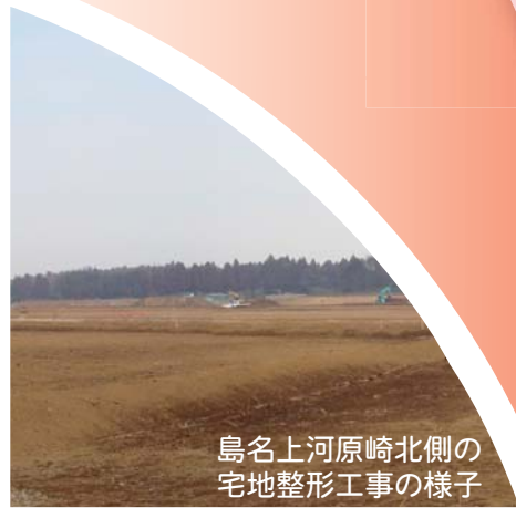
島名上河原崎北側の宅地整形工事の様子