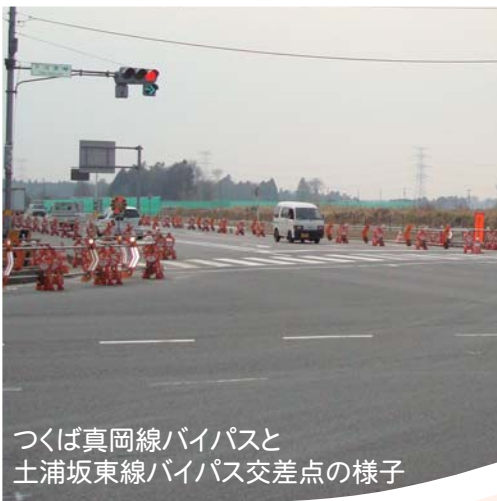
つくば真岡線バイパスと土浦坂東線バイパス交差点の様子