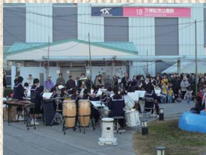
高山中学校吹奏楽部による演奏