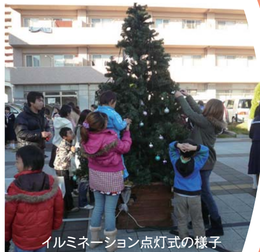
イルミネーション点灯式の様子