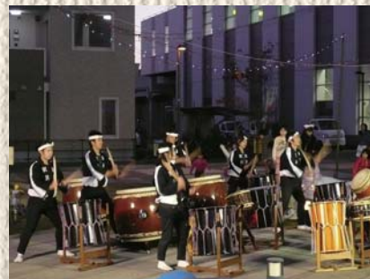
樹波による和太鼓の演奏