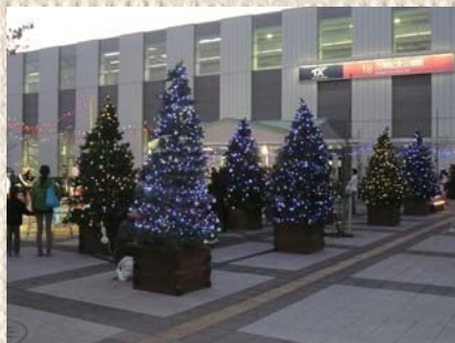
駅東口イルミネーション