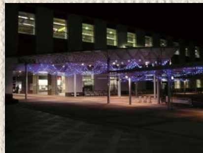
駅西口イルミネーション