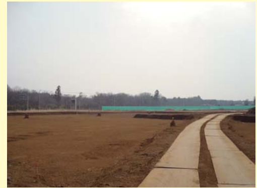
②計画拠点街区の造成工事の様子