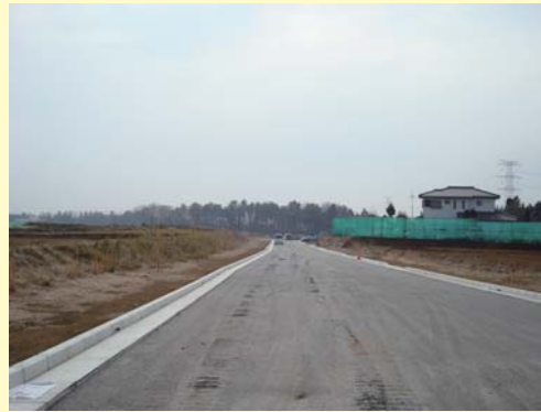
①上河原崎西環状線の道路工事の様子