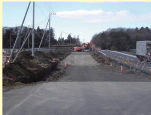
③つくば真岡線バイパスの道路改良工事の様子