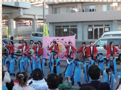
島名杉の子保育園アトラクション