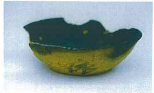
「依」と書かれた墨書土師器