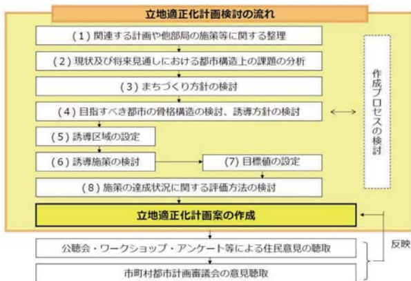
〈立地適正化計画検討の進め方〉

立地適正化計画は、都市計画区域全体が対象となり、作成しますが、土地利用の状況や、日常生活圏、経済圏等を勘案し複数の市町村が連携して作成することも可能です。計画策定にあたり検討すべき内容としましては、①まちづくりの方針（どのようなまちづくりを目指すのか）、②目指すべき都市の骨格構造と誘導方針の検討（どこを都市の骨格にするのか。どこにどのような機能を誘導するのか）、③居住誘導区域、都市機能誘導区域と誘導施設の設定と誘導施策の検討（具体的な区域、施設をどう設定するのか）の3つの検討が必要となります。まずは、都市の現状の分析が必要であり、人口の現状や将来見通しだけでなく、公共交通、都市機能施設、災害の危険性のあるハザード区域についても現状を分析することが重要です。