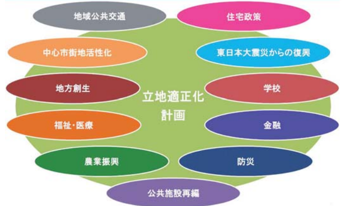
〈関係省庁の連携によるコンパクトシティ推進のイメージ図〉

講義の中で、「立地適正化計画策定の際に区域の設定に囚われがちだが、一番大切なのは、都市の現状を客観的に分析し、20年後にも持続可能な都市としてどのように目指すのかを検討することである。そうすれば、自ずと区域や必要な施設は見えてくる。」とのお話がありました。都市計画の担当者への提言としては、大変強く印象付けられました。