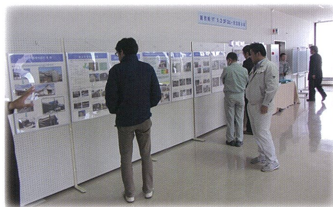
東日本大震災復興パネル展