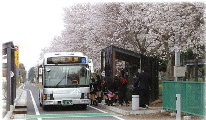
鹿島鉄道跡地バス専用道化事業