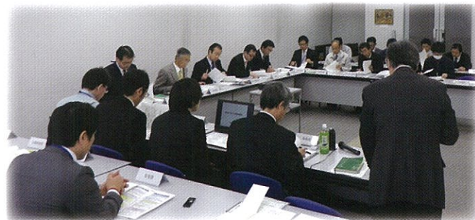
まちづくり推進協議会