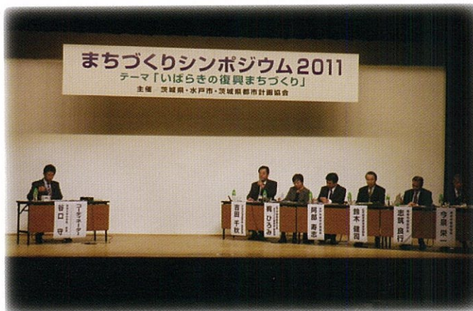
パネルディスカッション

また、当日はまちづくりに多大な貢献があった団体等を表彰する「茨城県うるおいのあるまちづくり顕彰事業」の表彰式も併せて行なわれ、まちづくりグリーンリボン賞については2件、まちづくりグッドサイン賞については1件が表彰されました。