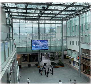
グランドプラザ内観

グランドプラザは富山市の中心市街地活性化基本計画の1つとして、隣接する立体駐車場と商業施設の2つの市街地再開発事業と一体的に整備を行ったもので、中心市街地の賑わいを創出することが目的のガラ