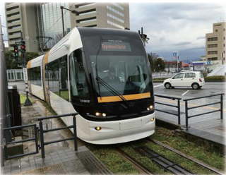
整備されたLRT(環状線)

利用者の減少が続いていたJR富山港線（鉄道）に公設民営の考え方を導入し、富山ライトレールとして整備することで、日本初の本格的LRTとして蘇らせました。