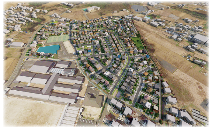
市街化イメージ図 (1)

新設調整地にて地区内の雨水を調整後、既存ひたち野みずべ公園内の調整池を経由し、小野川に放流する。