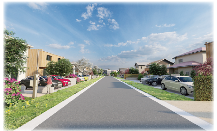
市街化イメージ図 (2)