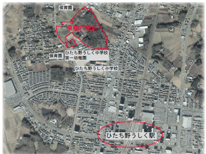
【令和5年】ひたち野うしく駅周辺