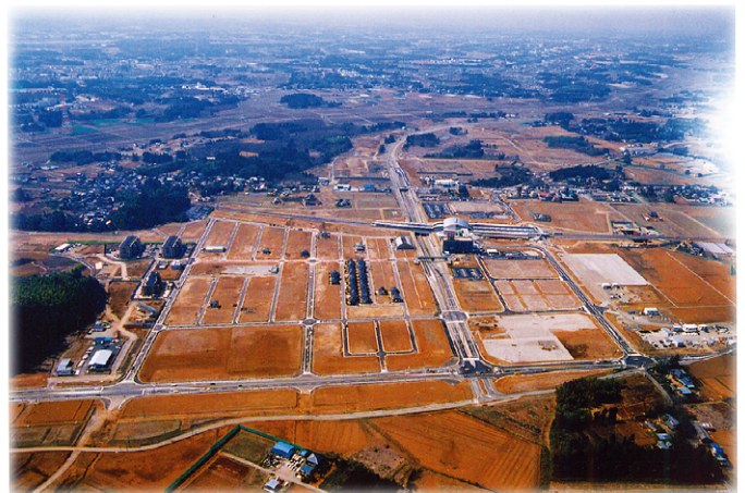
【平成10年】ひたち野うしく駅周辺

現在、地区の特性に応じた適正な土地利用を実現するため、区域区分の見直し作業と並行して、土地区画整理組合設立に向けた準備を進めています。