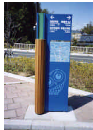
<受賞者> 取手市, (株)乃村工藝社, (株)アレスコ

受賞者に対しては、平成15年11月22日(土)に常陸太田市で開催予定の「まちづくりシンポジウム2003」の席上、知事の賞状と副賞を贈呈します。