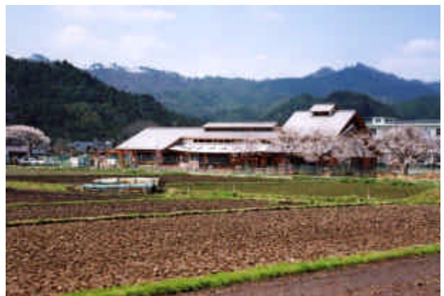
< 受賞者 > 里美村，(株)横須賀満夫建築設計事務所，日立土木(株)

自然豊かな周辺景観と調和した幼稚園を建設。越屋根や下屋など、旧来の建物の構成を取り入れ、換気や採光に自然の活用を積極的に取り入れる試みがなされています。