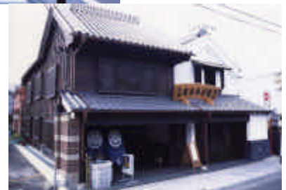
< 受賞者 > 土浦市