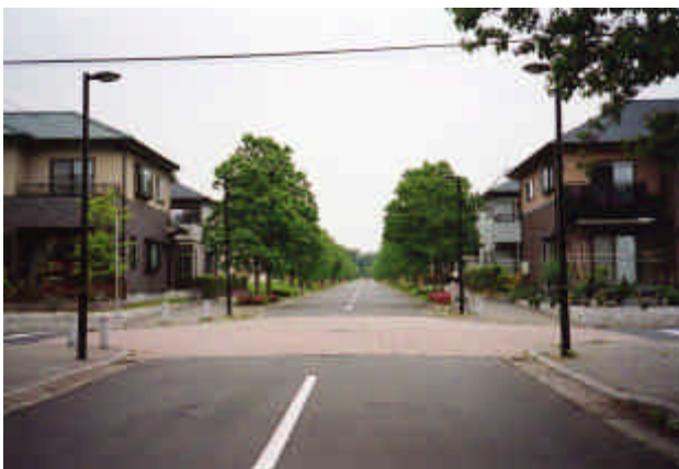
< 受賞者 > 株式会社日立ライフ < 所 在 > ひたちなか市

住宅団地を造成するにあたり、市と建築協定を締結して、建ぺい率や容積率、色彩等に一定の制限を設けるとともに、調整池を憩いの場とするなど、緑と潤いのあるまちづくりを実践しています。