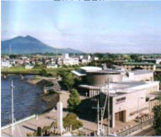
下館市立図書館 (下館市 H12まちづくりグリーンリボン賞受賞)