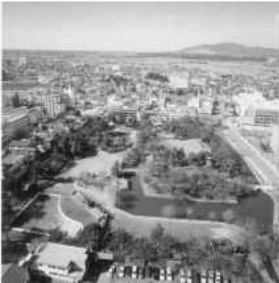
[土浦城址，現在の亀城公園，遠方に筑波山を望む]

土浦は、江戸時代に土浦城（現在の亀城公園）の城下町として繁栄し、それが基盤となって現在までの歴史を刻んできました。1600年代の半ばには、霞ヶ浦、利根川、江戸川を經由して、江戸へつながる水運の道ができると、土浦は、江戸への玄関口として、さまざまな物資の集散地となり、土浦城下を通る水戸街道沿道や市内を流れる川沿いに、立派な町屋や蔵が軒を連ね、活気のある城下町として発展してきました。