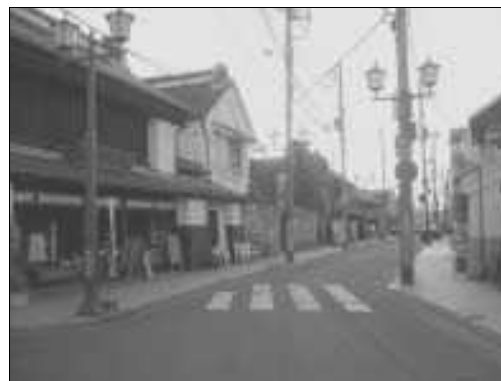
電線地中化・整備後のシュミレーション写真