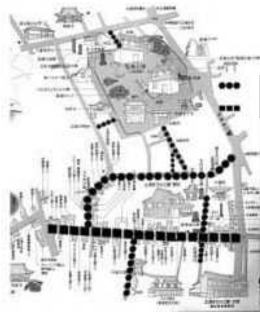
[歴史の小径整備事業位置図]