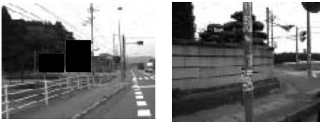
道路沿線の市街化調整区域(禁止地域)に表示されたはり紙 電柱(禁止地域)に表示された野立広告

県ではこれまでも、各市町村との協同により違反広告物の是正に取り組んできたところですが、今後は次のとおり取り組みを進めていきます。