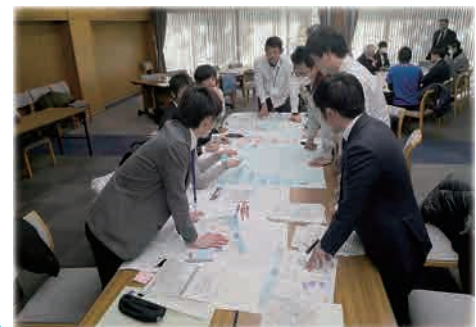
ワークショップの様子→