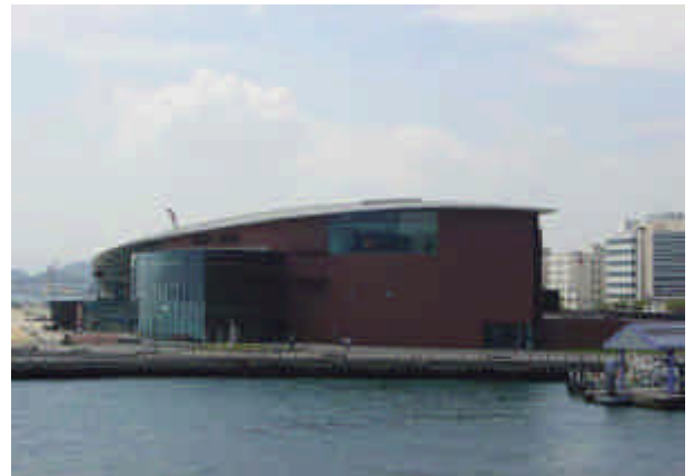
< 2002年 受賞作品 :しものせき水族館「海響館」 >