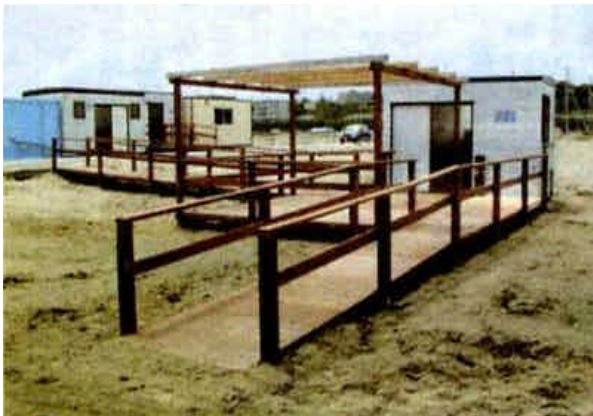
< 砂浜に降りるためのスロープ >

このように、あらゆる人々が不自由なく利用できるような製品や建物、環境をデザインすることを「ユニバーサルデザイン」と呼んでいます。海水浴場は、駐車場と砂浜との段差や異動しにくい砂浜など利用者にとって様々な障害があるため、もっともその実現が難しい環境にあります。