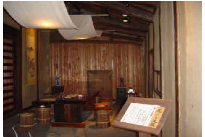
< 男女川と星をイメージしたギャラリー >

古き良き伝統を守りながら、新しいものを取り入れ育てていく、今回お話を伺って、これからのまちづくりのヒントを頂いたような気がしました。