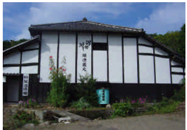
< 白壁の蔵 >

江戸末期(1867年)の創業以来、筑波山から流れ出てくる伏流水を使って、酒作りが続いてきました。