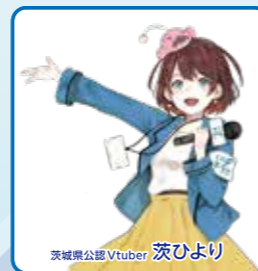
茨城公認VTuber 茨ひより