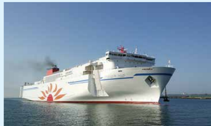
さんふらわあ ふらの

配船船舶 ・さんふらあ さつぼろ(13,816G/T) 積載能力・・・トラック154台、乗用車146台、旅客定員590名 ・さんふらあ ふらの(13,816G/T) 積載能力・・・トラック154台、乗用車146台、旅客定員590名 ・さんふらあ じれとこ(11,410G/T) 積載能力・・・トラック160台、乗用車62台、旅客定員154名 ・さんふらあ だいせつ(11,401G/T) 積載能力・・・トラック160台、乗用車62台、旅客定員154名