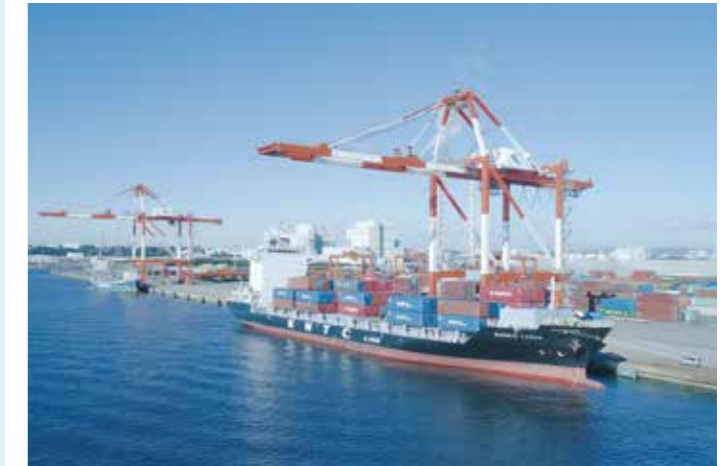
韓国・中国定期コンテナ船