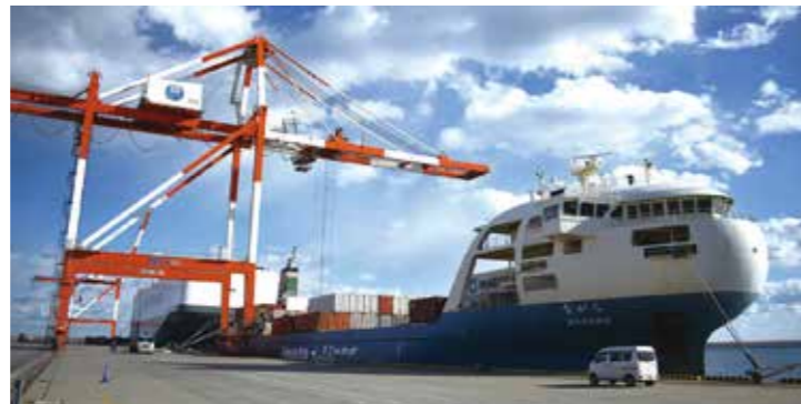
国際フィーダー船