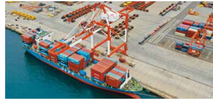
中国定期コンテナ船