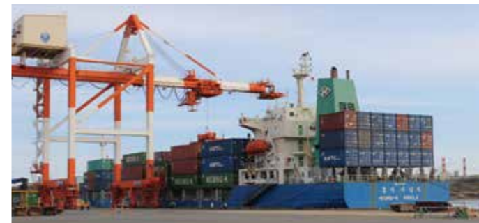
韓国定期コンテナ船