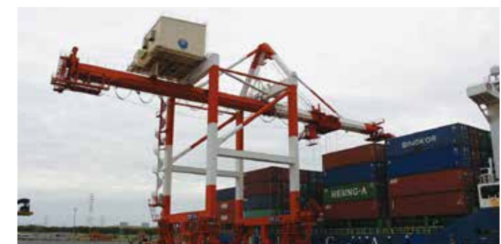
外航コンテナ船の荷役