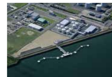
鹿島タンクターミナル