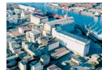
飼料コンビナートの風景