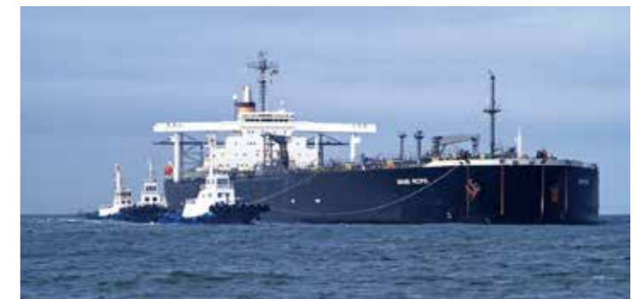
入港する大型タンカー