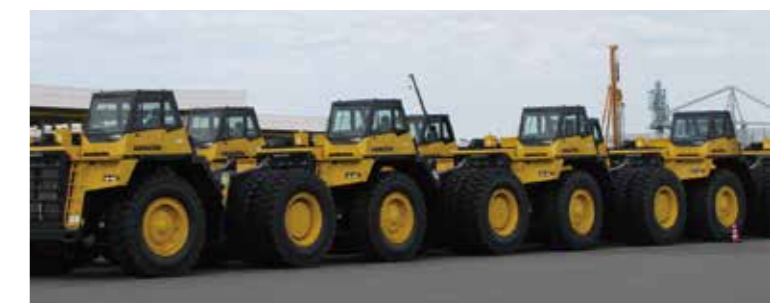
建設機械の荷役(左:日立建機、右:コマツ)