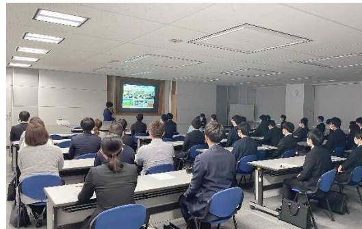
（写真2）説明時の状況写真