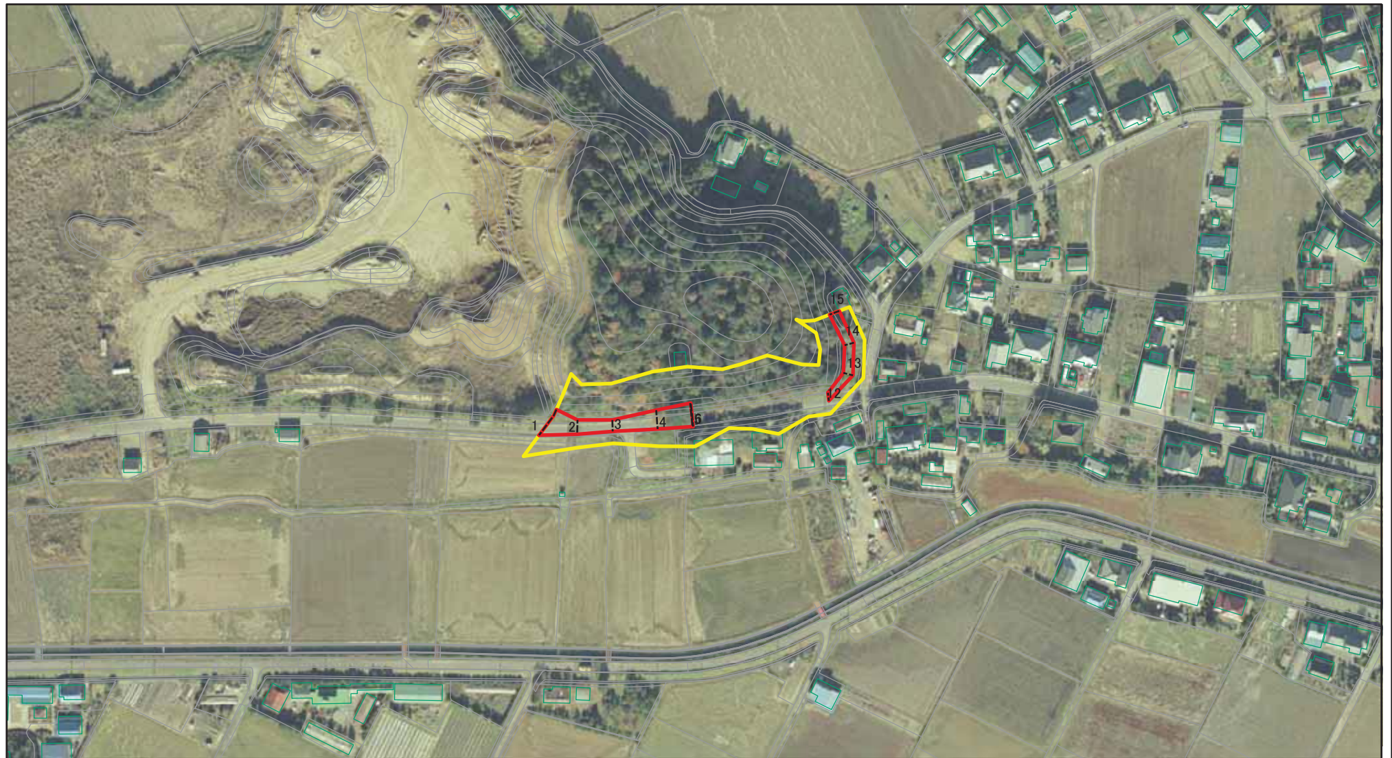
図中の数字は横断測線番号を示す